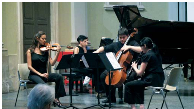
«Bazar della Musica 2014» Como, Auditorium del Conservatorio. Musica da camera.