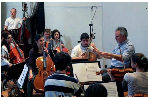
«G. Verdi, Il Corsaro» Como, Salone dell'Organo del Conservatorio. Prove d'Orchestra.

Al termine del corso sono previste una prova aperta e due esecuzioni pubbliche