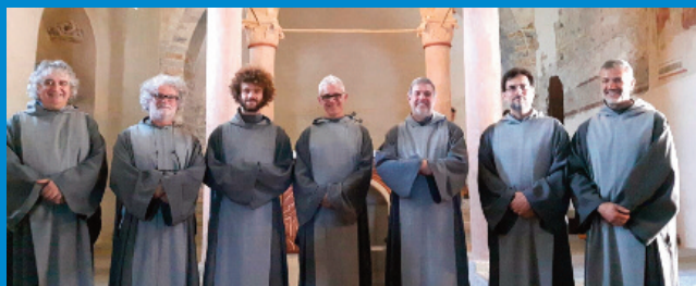
Coro "Antiqua Laus" (Italia)