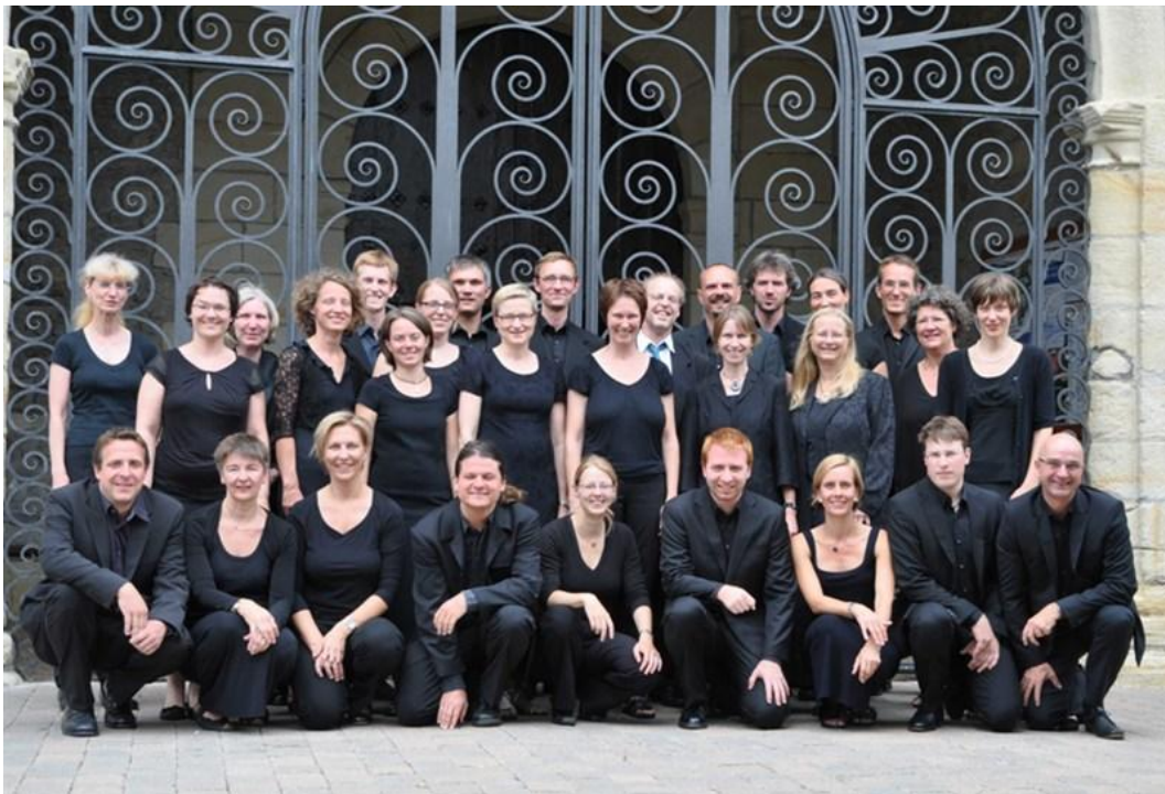
Il Coro Piccolo di Karlsruhe