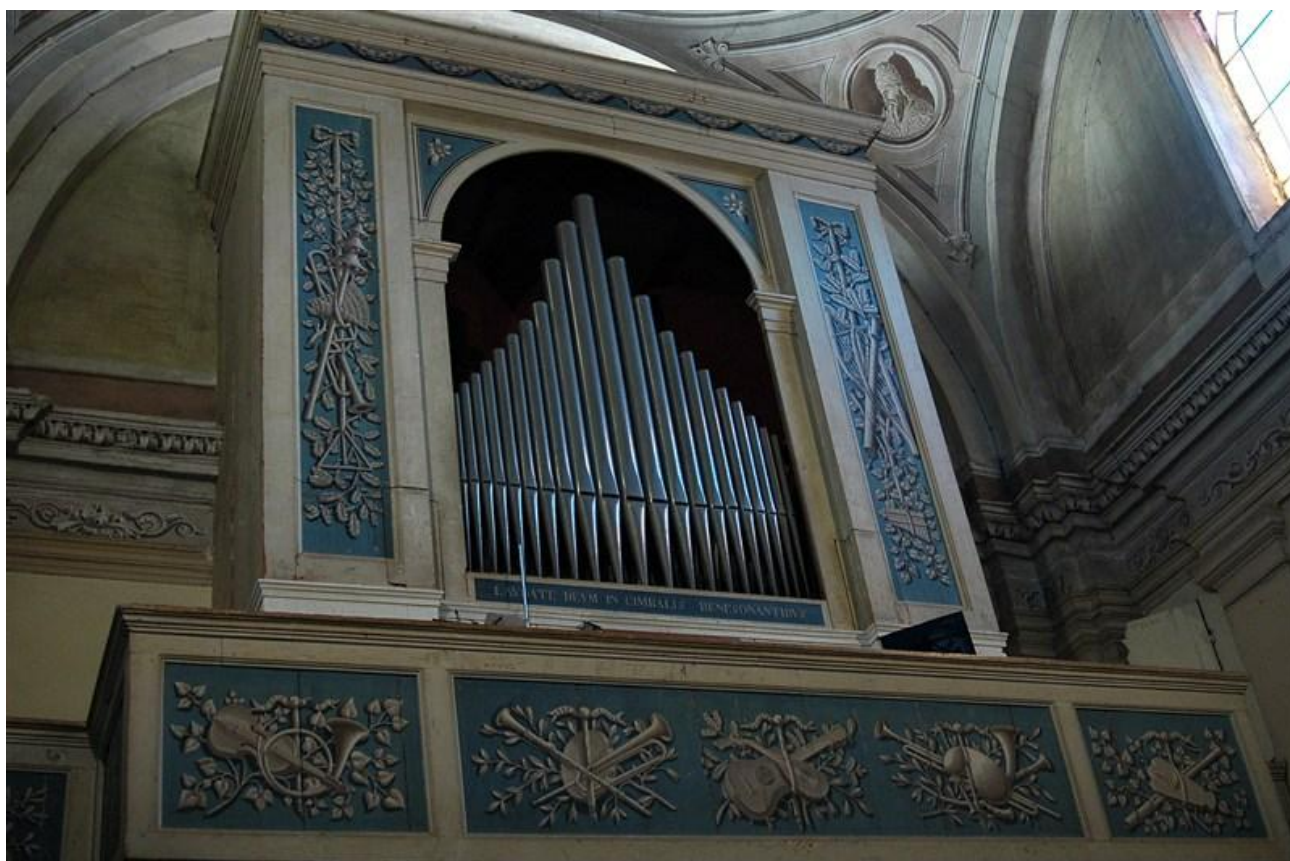
L'organo Prestinari 1821 di Blevio