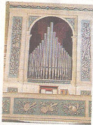
L'antico organo Prestinari